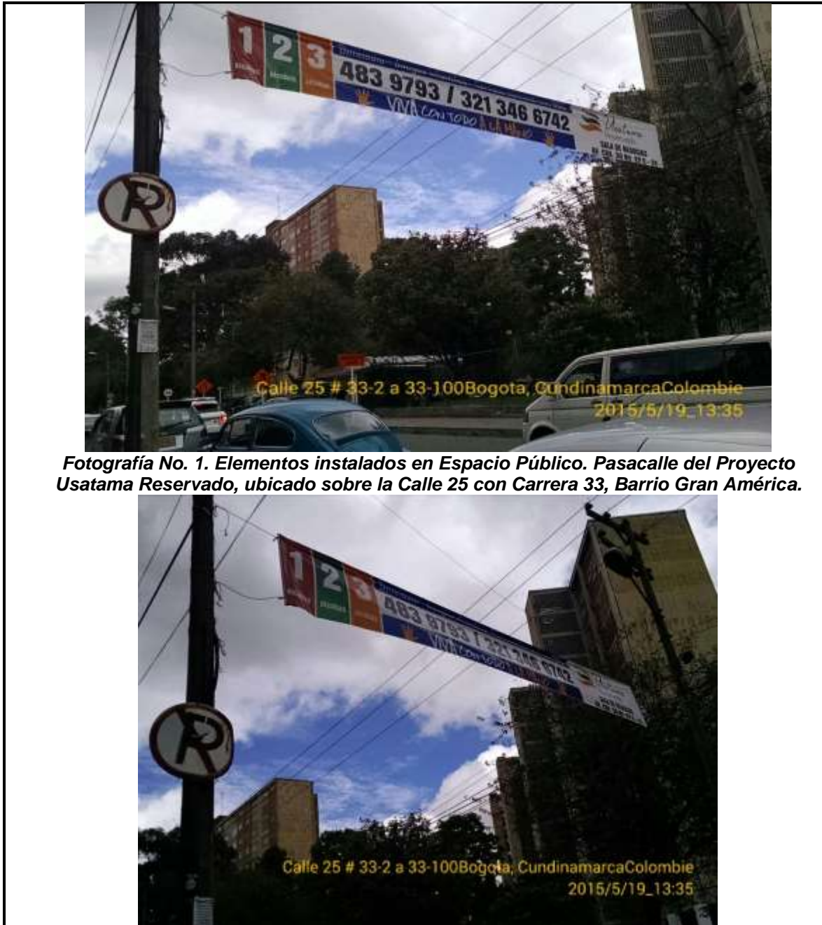
Fotografía No. 1. Elementos instalados en Espacio Público. Pasacalle del Proyecto Usatama Reservado, ubicado sobre la Calle 25 con Carrera 33, Barrio Gran América.

Registro fotográfico, Visita de Control efectuado el día 19/05/2015