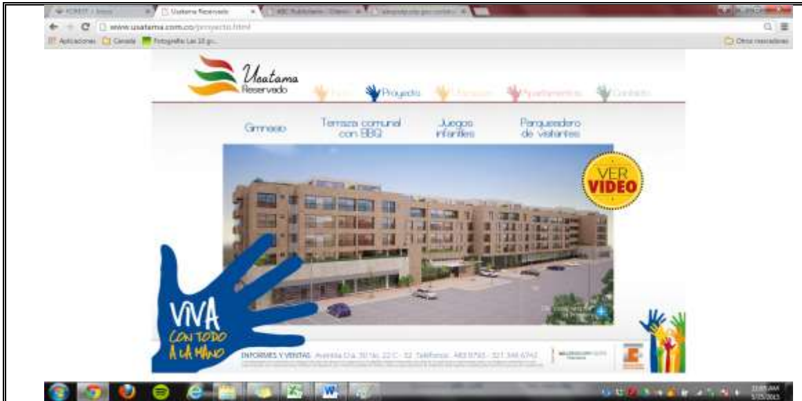
Fotografía No. 2. Página Web del Proyecto Usatama Reservado, en donde se evidencia que este proyecto pertenece a la sociedad PROMOTORA CONVIVIENDA S.A.S.